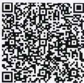
Sello Digital del CFDI